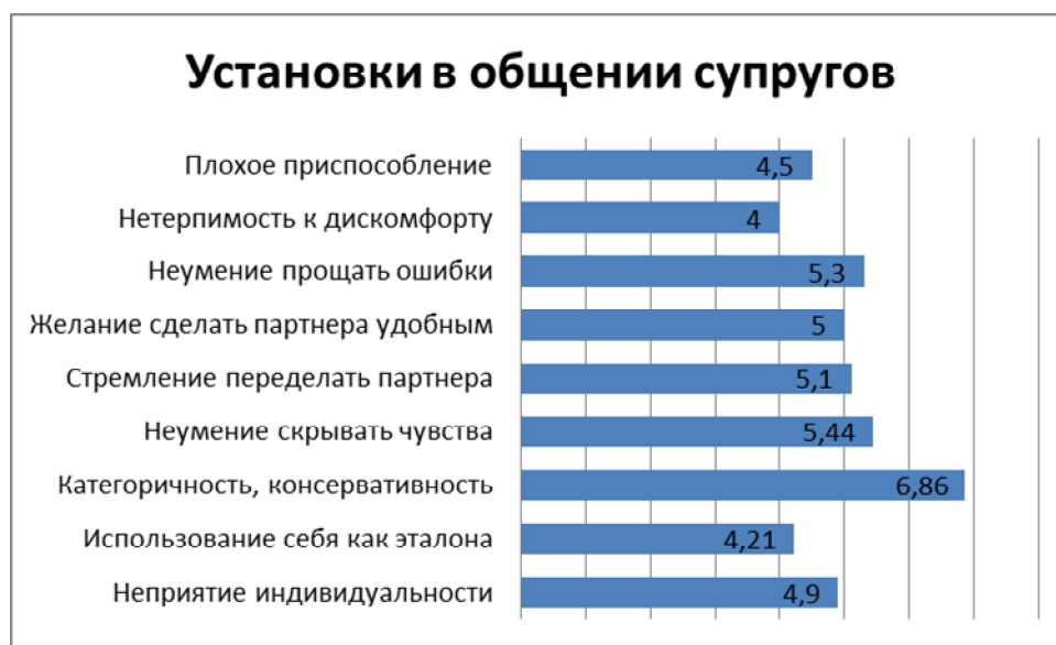
Рис. 2. Выраженность стратегий и установок в межличностном общении супругов (ср. зн.)

Выделение неверных установок в общении помогает увидеть индивидуальные особенности супругов, определить направления психологической помощи им. Данные изучения установок представлены на рис. 2.